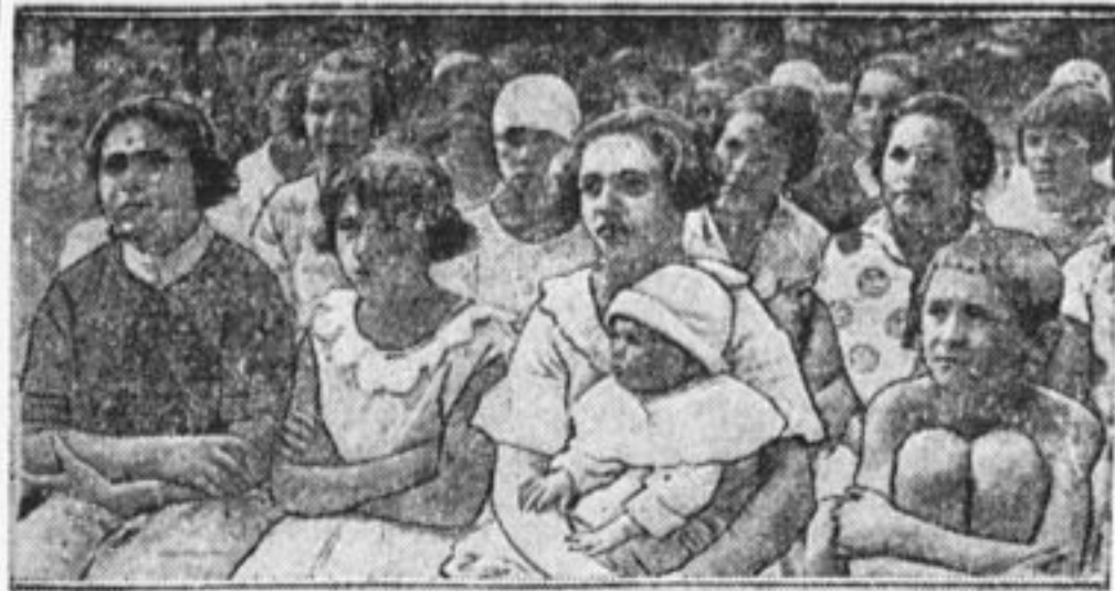
Конференция нянь в Бауманском районе.

В 4 ч. 30 мин. делегаты посещают Большой театр, цирк Шапиро и театр эстрады.