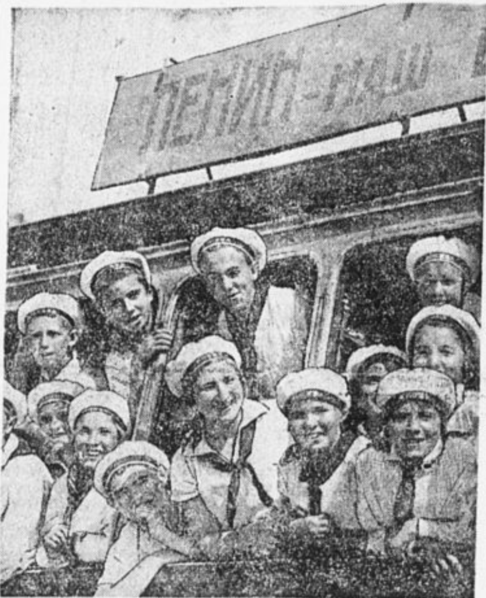
Трамвай переполнен. Он гостей везет к стадиону «Динамо» на слет.

Юные ленинцы! Вместе с нами, с комсомольцами, вместе со всеми трудящимися, вы двинулись в культурный поход против неграмотности, грязи и пьянства; вместе с вашими отцами и братьями вы выступили в поход за урожай и коллективизацию, создав тысячи колхозов, организовав коллективные грядки и участки; вместе с нами вы проводили субботники, собирали лом, строили фабрично-заводские семилетки и организовывали соревнования; вместе с нами вы боретесь за трудовую школу, за всеобщее обучение, за искоренение детского