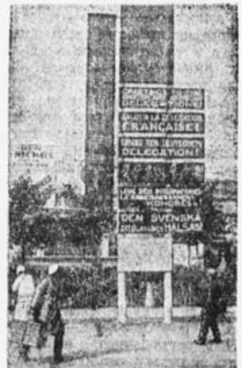
Москва пестреет приветствиями слету на всех языках.

Так пусть же этот голос услышат миллионы наших друзей и всего мира. Пусть этот голос услышат наши враги. И вместе с