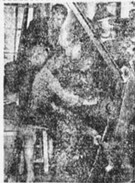
Делегаты слета посетили фабрики и заводы Москвы.

пролетариата слет приветствует секретарь МК ВКП(б) тов. Бауман.